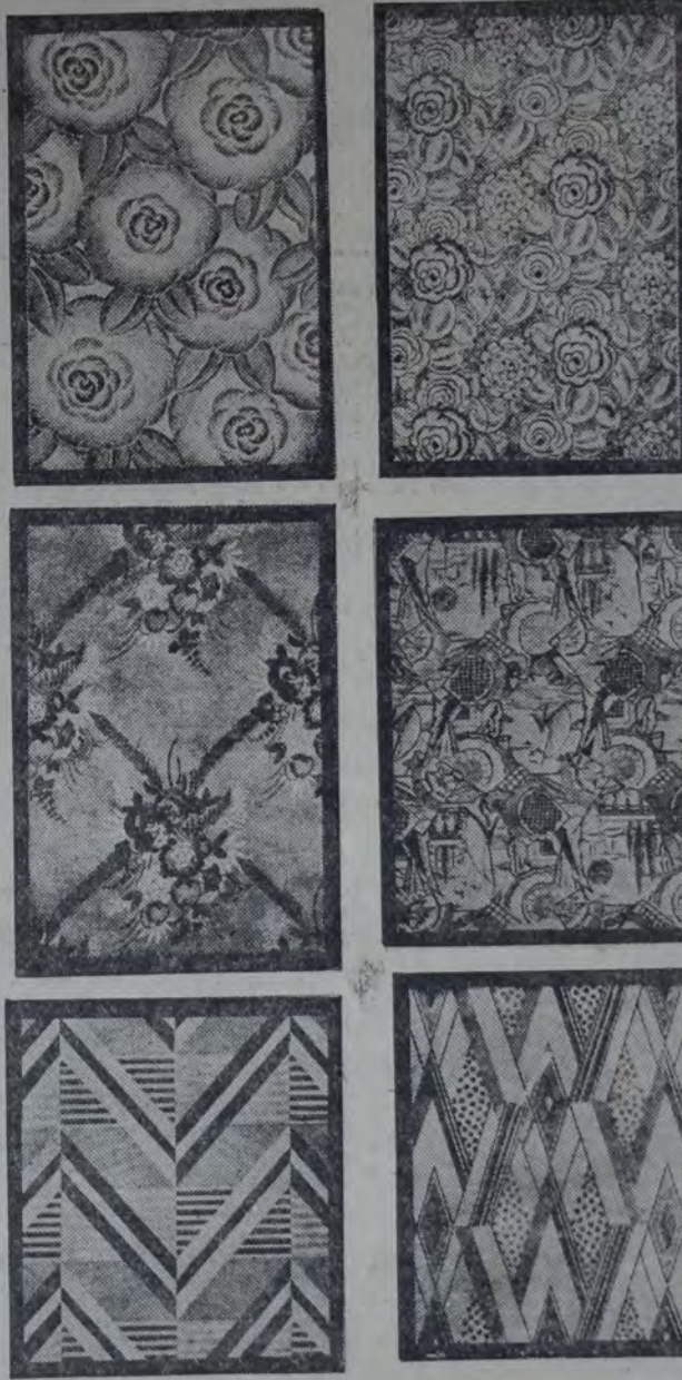
HA LLEGADO HASTA LOS PAPELES DESTINADOS A LA DECORACION MURAL, LOS GRABADOS QUE PUBLICAMOS SON UNA MUESTRA DE LO QUE SE PUEDE HACER EN ESTE SENTIDO